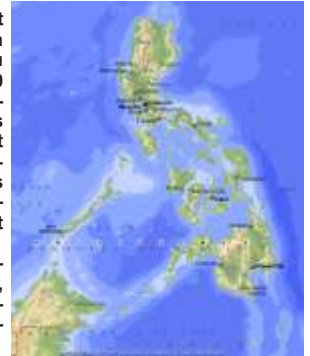
Les Philippines. Carte extraite de l'Atlas Mondial Encarta de Microsoft ©

Malgré des richesses minérales variées (or, argent, fer, chrome, cuivre, manganèse), le pays demeure essentiellement agricole avec principalement la culture du riz et du maïs. Petit Larousse 1975