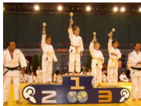
Le jour de la fête du Judo, podium Filles.

CADETS (F/M) : Inter Région Romain BATTE (-90 kg) 1 er