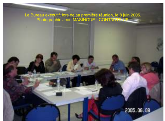
Le Bureau exécutif, lors de sa première réunion, le 8 juin 2005. Photographie Jean MASINGUE - CONTACTS US

SPORTS - ATHLETISME ESPACES DE PROXIMITE - PISCINES TRIBUNES JEUX ET AIRES DE JEUX