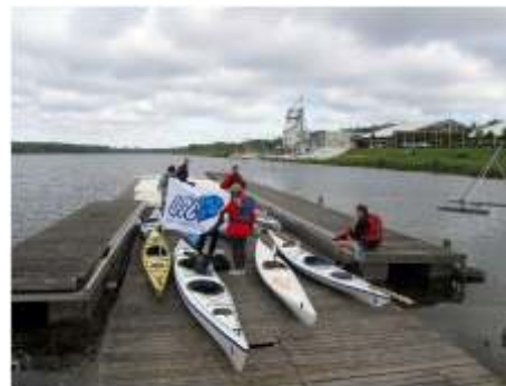
Défi Handikayak Vaires-Paris 2012 (mai 2005). Départ de la base de Vaires-sur-Marne.

La pratique du handikayak a commencé dans les années 80, et, par manque d'information ou de promotion, je suis passé à côté pendant vingt ans. Jusqu'à peu de temps encore, les activités proposées au handicapés étaient essentiellement du tourisme en eaux calmes, voir en mer, par stages ponctuels, certes agréables, mais limités et inadéquates à une pratique régulière. J'oserais dire que le "tour de manège" terminé, il nous restait à aller voir ailleurs et retrouver l'indifférence en attendant le prochain ticket. Alors qu'il est plus intéressant et profitable de pouvoir pratiquer toute l'année dans un club de "valides" connaissant les problèmes spécifiques