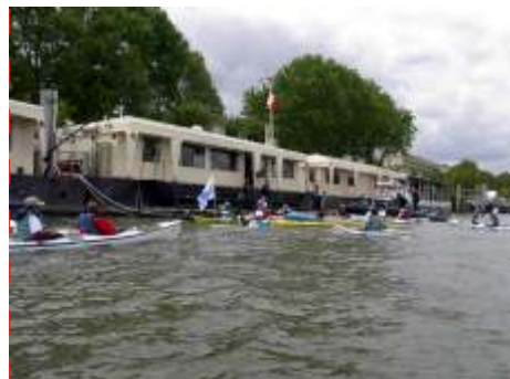
Défi Handikayak Vaires-Paris 2012 (mai 2005). Arrivée à Paris, merci à la Brigade fluviale.

Les infrastructures ne sont pas toujours des plus accessibles ; que ce soit les berges des rivières, les piscines, les stages d'eaux vives, les pontons d'embarquement, les passages d'écluses souvent impossible.