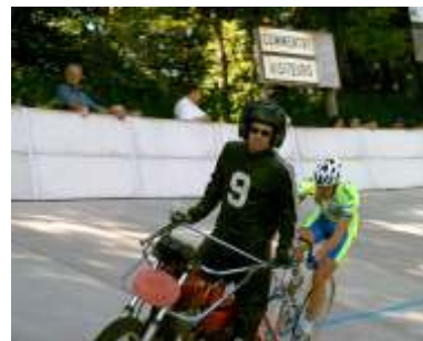
Championnat de France à Commeny le 18 juin 2005.