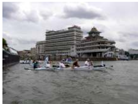
Défi Handikayak Vaires-Paris 2012 (mai 2005). Clin d'oeil à Pékin 2008 !

Handisport de l'US Créteil, qui, avec quelques clubs de province est en avance sur la région parisienne. Avance encore plus grande au Canada, en Italie, aux USA ou en Grande Bretagne. Pouvoir pratiquer le canoë-kayak dans tous les milieux