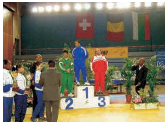
Le Podium par Equipes : France, Biélorussie, Pologne.