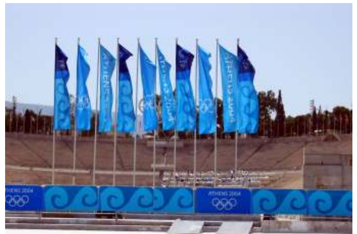
Les installations olympiques.