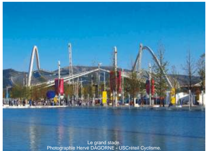
Le grand stade.

Isabelle BRYNKUS, Adjointe au Directeur technique, US Créteil.