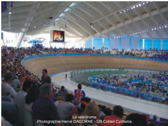
Le vélodrome.

Le lendemain de notre arrivée, nous avons découvert, avec émerveillement, le site olympique qui regroupait stade olympique, piscine et vélodrome. Et quel vélodrome ! Celui dont nous n'avions même pas osé rêver, couvert mais ouvert, beau et convivial avec un nombre de places restreint d'où le spectacle ne peut être que fabuleux. Et fabuleux il fut, avec une pléthore de records olympiques et mondiaux, et en particulier une équipe australienne éblouissante dans plusieurs disciplines.