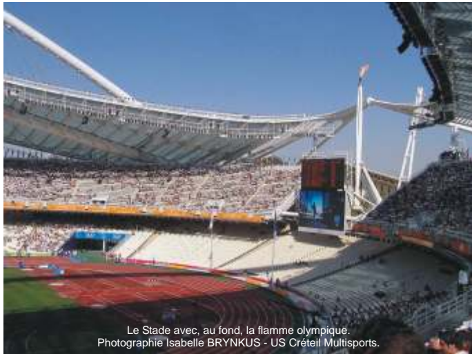
Le Stade avec, au fond, la flamme olympique.

Accueillis par Gilles et Isabelle, nous sommes vite informés des modalités de séjour pour rallier ensuite nos points de chute respectifs.