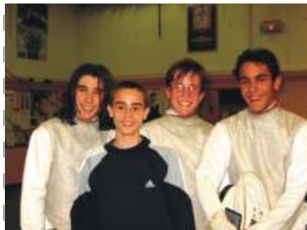
Les quatre Cristoliens sélectionnés pour "Horizon 2008".

La Ligue d'Escrime de Créteil regroupe la Seine et Marne (77), le Val-de-Marne (94) et la Seine-Saint-Denis (95) et est parmi les plus performantes de France. La Ligue vient de qualifier, pour l'épreuve d'Interzone "HORIZON 2008", qui se déroulera le 4 avril prochain à Lille, ses 30 meilleurs fleuretistes dont les 3 Cristoliens :