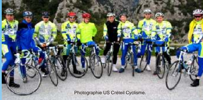
Photographie US Créteil Cyclisme.

Plus de 1000 kilomètres ont été avalés par les coureurs de notre équipe phare (720 pour les juniors), durant le séjour. Un gros travail qui devrait porter ses fruits dès les premières compétitions sur route du mois de mars.