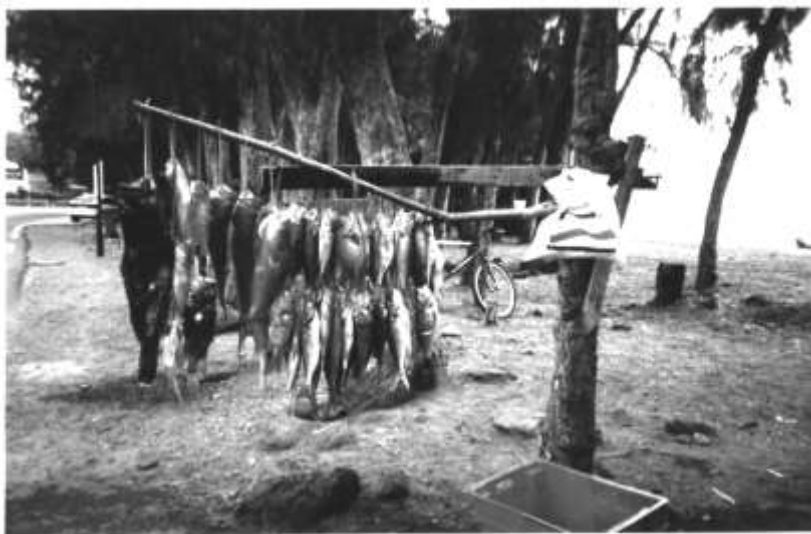
Vente de Poissons au bord de mer.

Tous nos remerciements vont au Club du Port, dont les Dirigeants, les Entraîneurs, les Parents, ont réservé le meilleur accueil à nos Gymnastes et à leurs Entraîneurs. Toujours disponibles, toujours à l'écoute, ils ont su faire de ce stage un merveilleux souvenir ou la beauté des paysages n'a d'égal que leur gentillesse.