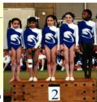
Notre Equipe sur le podium

LES NOTES ENTRE PARENTHESES NE SONT PAS PRISES DANS LES TOTAUX, SEULES LES QUATRE MEILLEURES NOTES À CHAQUE AGRÈS SONT RETENUES