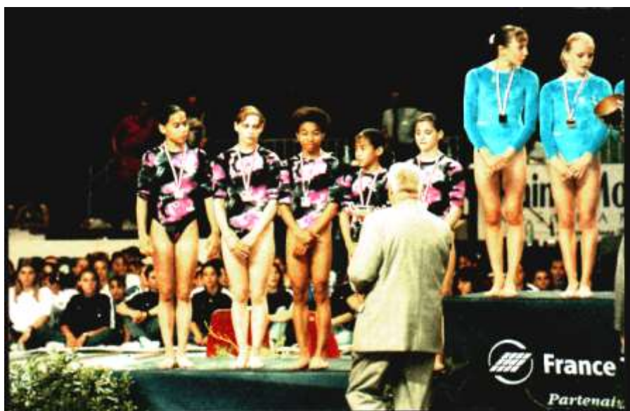
L'équipe de Creteil sur le podium à Strasbourg.